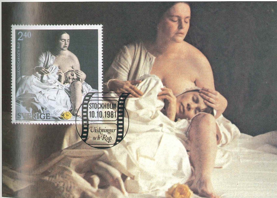
Sello, matasellos y tarjeta postal de Suecia dedicados a la historia del cine sueco (emisión de 1981).

«Fabil», que contó en triángulo con la carretera con una larga lista de sus cuentas con el nombre: «Capex» (Madrid), «Espamer'80» (Madrid), «4» (Madrid),