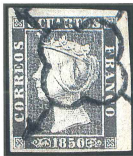
Primer sello de España, el 6 cuartos de 1850, obliterado con un matasellos tipo «araña».

La marca postal aplicada —manual o mecánicamente— por el servicio de correos para anular o cancelar un sello se denomina matasellos; el tipo de coleccionismo que los estudia y clasifica recibe el nombre de marcofilia.