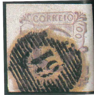
Sello de Portugal, el Doña María de 100 reis de 1853, cancelado con un matasellos «numeral» de Guimaraes.