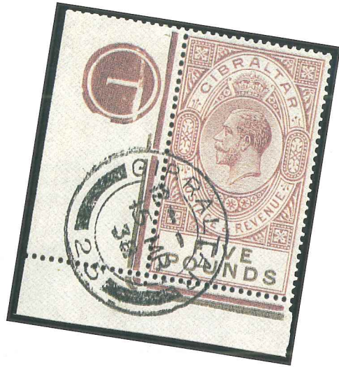
Sello de Gibraltar de 5 libras de 1931-1932, con borde de pliego, cancelado con un matasellos «fechador».

Los matasellos contemporáneos pueden clasificarse en base a su utilización en ordinarios, mudos, parlantes, especiales, conmemorativos, de favor, de primer día, ambulantes, aéreos y navales. Si bien los más conocidos y utilizados son los denominados ordinarios o fechadores