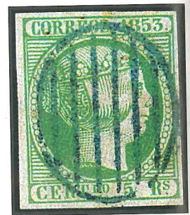
Sello de España, el 5 reales de 1853, cancelado con un matasellos tipo «parrilla».

Entre las particularidades ligadas a la celebración de una exposición internacional de filatelia destacan los matasellos conmemorativos. Los organizadores de estos eventos ofrecen a los coleccionistas la posibilidad de obtener diferentes obliteraciones alusivas a la exposición, tanto las oficiales del correo del país organizador como las de los países invitados. De este modo, las exposiciones mundiales «Espamer'96» y «Aviación y espacio'96», celebradas en Sevilla del 4 al 12 de mayo de 1996, contaron con una gran variedad de matasellos. En primer lugar, el 20 de diciembre de 1995, en Madrid y Barcelona, funcionaron rodillos parlantes alusivos a las exposiciones como publicidad postal de las mismas. A éstos se sumaron, en las fechas propias del evento, un total de once matasellos especiales españoles (el general de la exposición, un ambulante del «Expotren filatélico», el de la inauguración y los de los días del deporte, la juventud, las comunicaciones, el arte y la cultura, Andalucía, la aerofilatelia, América y la astrofilatelia) y treinta y cuatro de las administraciones extranjeras participantes.